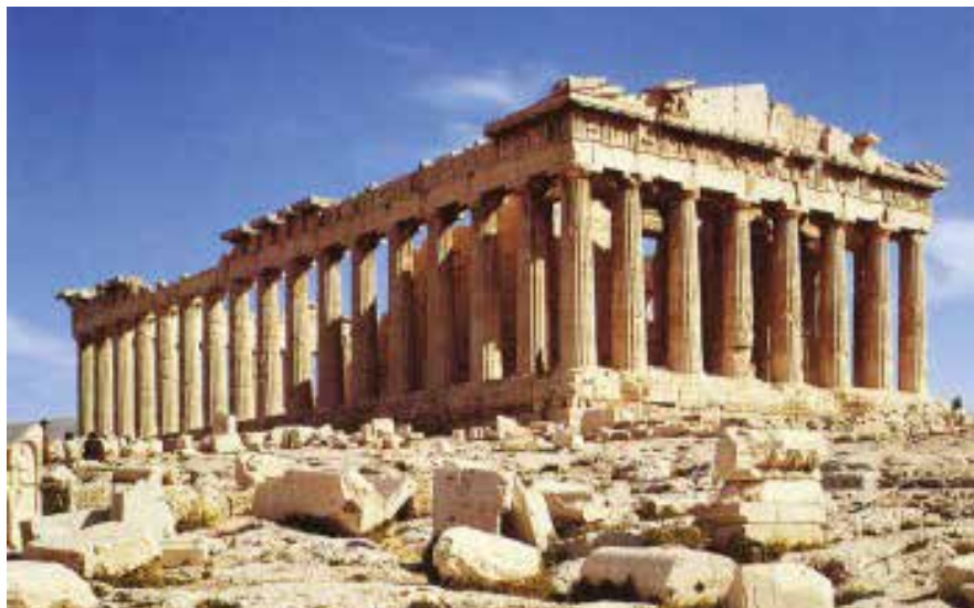
ŘECKO - AKROPOLIS - ATHÉNY