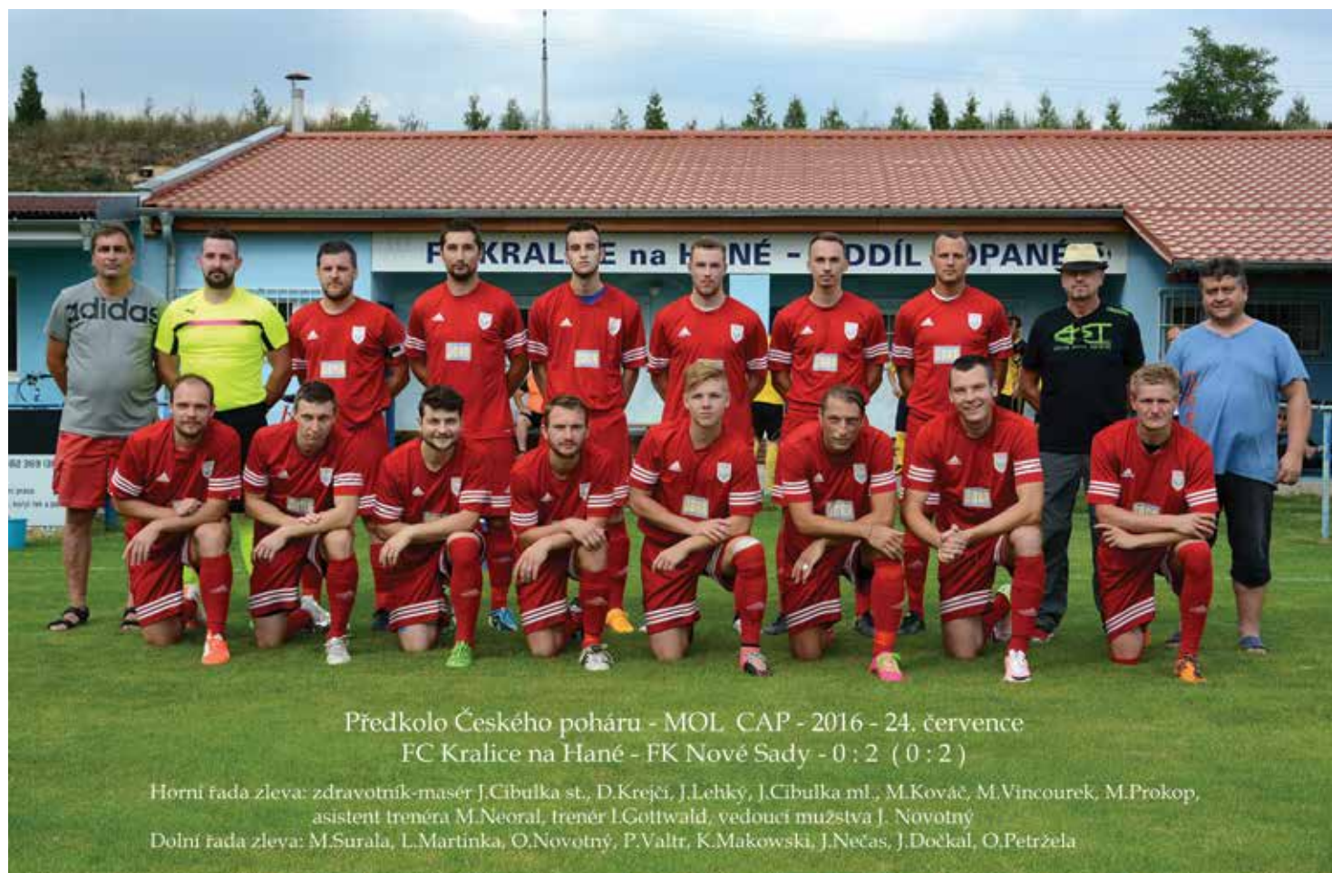
Předkolo Českého poháru - MOL CAP - 2016 - 24. července FC Kralice na Hané - FK Nové Sady - 0 : 2 ( 0 : 2 )

Předseda Olomouckého krajského fotbalového svazu v Kralicích na Hané.