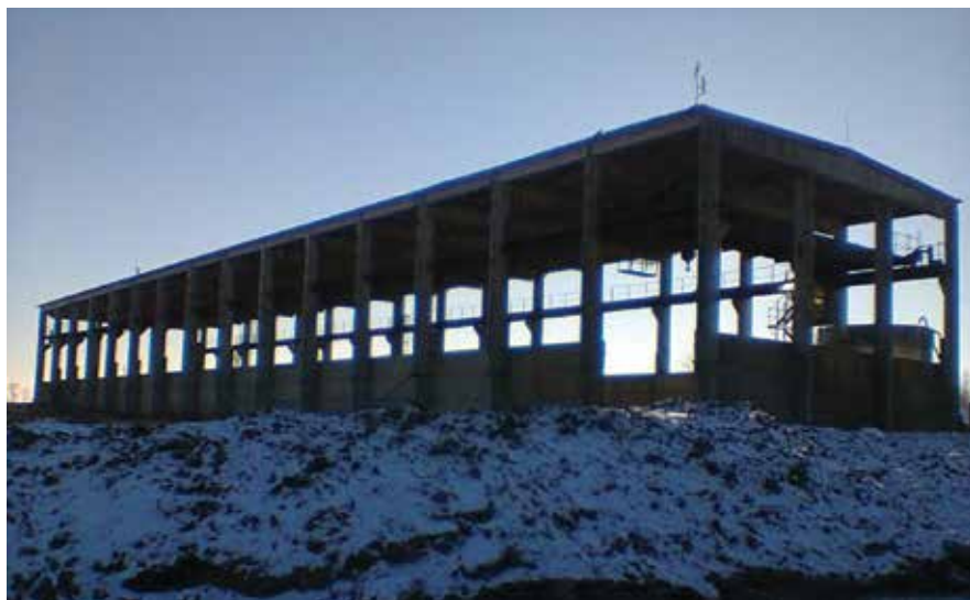
ČESKÁ REPUBLIKA - AKROPOLIS - KRALICE NA HANÉ